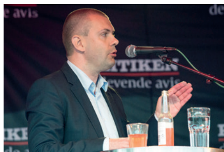
Tidligere finansminister Bjarne Corydon spillede en afgørende rolle i skolepolitikken 2013-14 (Foto fra 2012)

"Nej, tværtimod. Jeg synes jo, at jeg prøvede at investere den politiske kraft, jeg havde. Jeg var også villig til at betale en forholdsvis høj politisk pris for at få en nødvendig forandring på glem. Det lykkedes