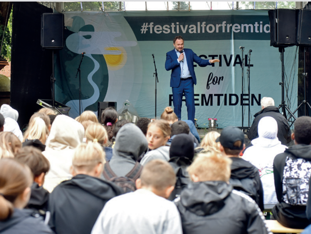
Klimaminister Dan Jørgensen (S) havde lagt vejen forbi Festival for Fremtiden.