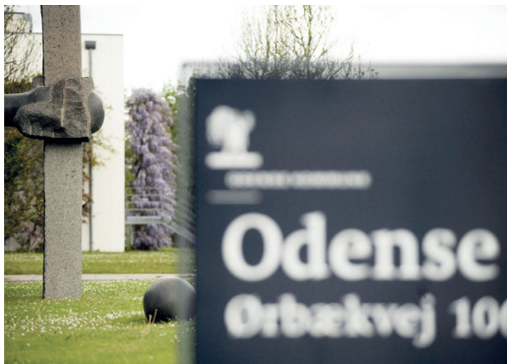
B&U-udvalget fik i august fremlagt forvaltningens tal for, hvor mange medarbejdere skolen har fået tilført siden 2017.