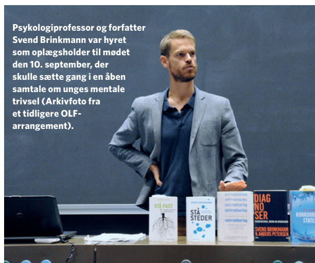
Psykologiprofessor og forfatter Svend Brinkmann var hyret som oplægsholder til mødet den 10. september, der skulle sætte gang i en åben samtale om unges mentale trivsel (Arkivfoto fra et tidligere OLF-arrangement).