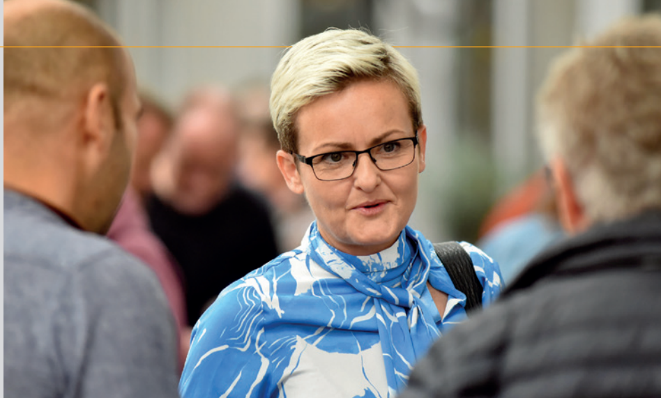
Gennem "Sammen om skolen" har den socialdemokratiske børne- og undervisningsminister Pernille Rosenkrantz-Theil fået etableret et fast samarbejdsforum, der kan gøre skolens parter til medspillere og skabe legitimitet.

over, at god undervisning kræver ordentlige rammer, herunder metodefrihed og ressourcer til forberedelse. Så det er noget, vi har fokus på både nu og fremover som værdipolitik.