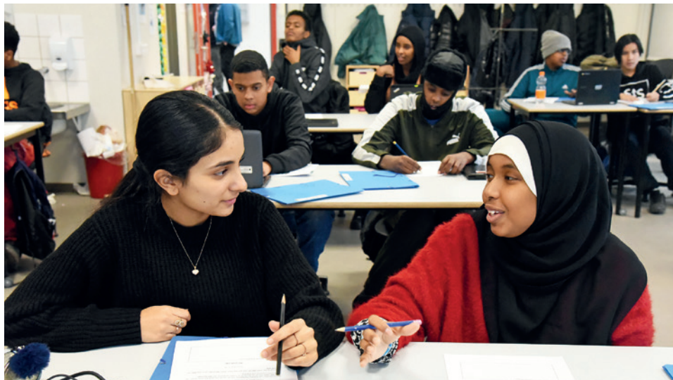
Eleverne er først i dialog med sig selv og derefter med den anden – som her belejligt er sidemakkeren.