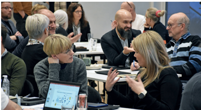
Efter de tre oplæg, blev hvert tema drøftet ved bordene.

skolen", som tidligere børne- og undervisningsminister Pernille Rosenkrantz-Theil tog initiativ til.