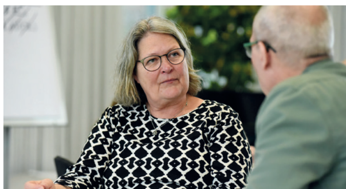
Også en formand og en konsulent kan have brug for lidt sparring.