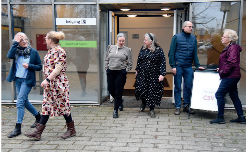
Efter at have holdt til på forskellige adresser i Odense blev de samlede lærerkrafter på VSU, som er en del af Center for Voksenspecialundervisning, CSV, i januar 2023 forenet i skolebygningerne fra 70'erne på Sædekildegårdsvej i Bellinge.

Der er tale om indtægtsdækket virksomhed, så der skal tales med jobkonsulenter, socialrådgivere og psykiatrien, og