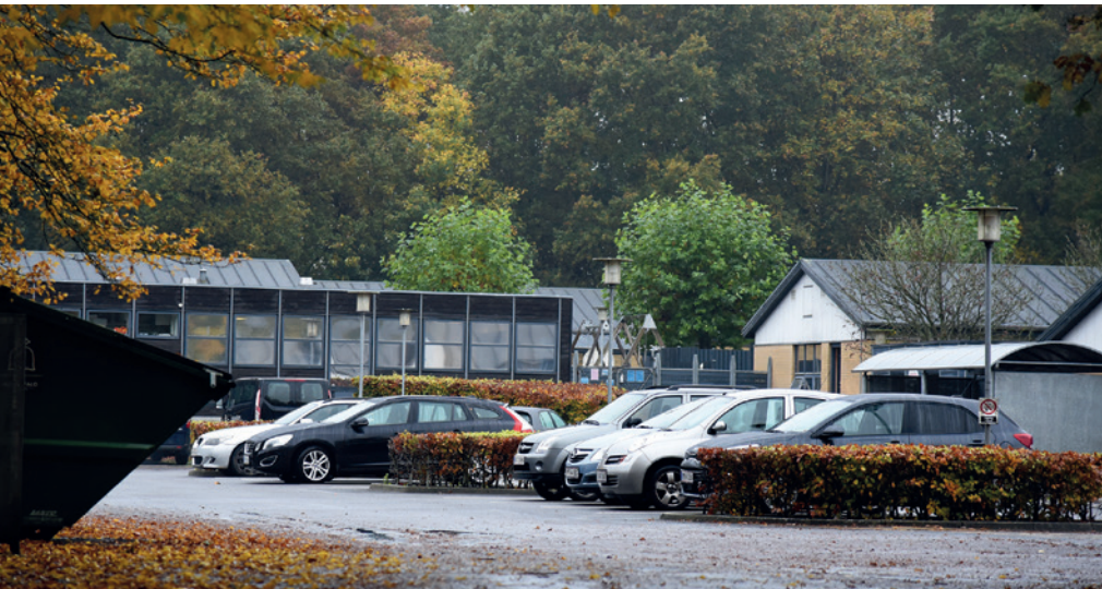
Enghaveskolen døjer ifølge skolebestyrelsen med for mange børn på for lidt plads, generel underfinansiering, støjgener, manglende personaleresourcer og utilstrækkelig faglighed.

SPECIALSKOLER // Enghaveskolen og Nørrebjergskolen, der rummer nogle af de vanskeligst stillede elever, lider på grund af dårlige normeringer og underfinansiering. Enghaveskolen i særlig grad af alvorlig pladsmangel. Lærernes arbejdsmiljø er udfordret. Skolebestyrelsen foreslår skolen flyttet.