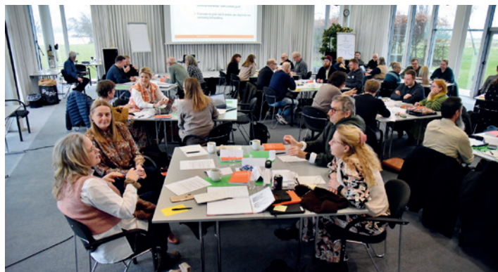
Tillidsrepræsentanterne blev sat på prøver med forskellige typer af forhandlinger.