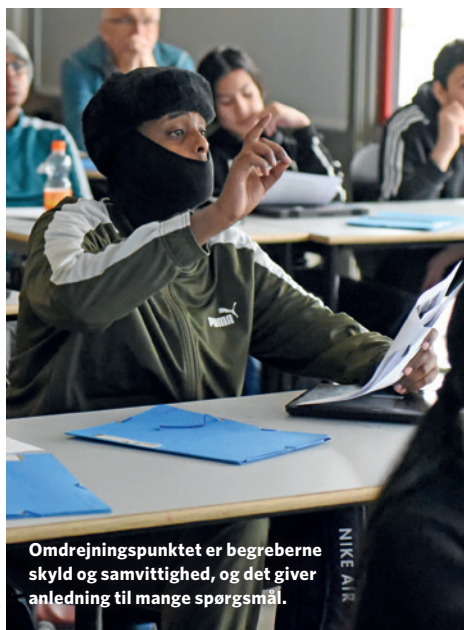
Omdrejningspunktet er begreberne skyld og samvittighed, og det giver anledning til mange spørgsmål.