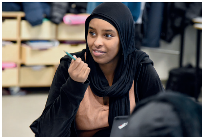
Eleverne lytter og virker for en udenforstående forbavsende interesserede, når man tager de filosofiske emner og spørgsmål i betragtning.

fældigt sammen med en klassekammerat, som de skulle diskutere deres citat med.