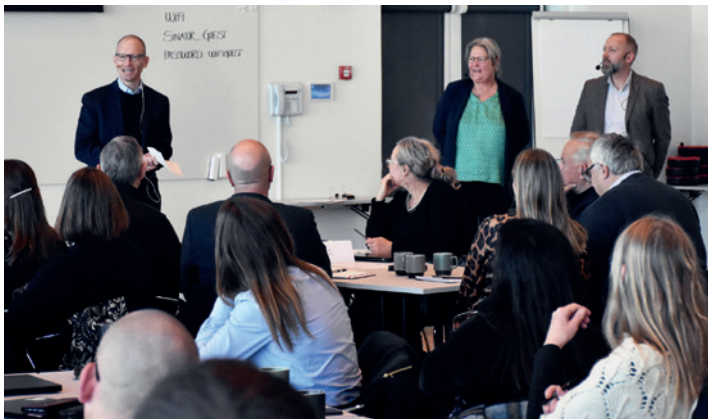
Konferencen blev indledt af arrangørerne, der skiftedes til at introducere oplæggene.

Konferencen var den første af sin art i et forsøg på at sparke gang i et tværgående samarbejde om skolen i Odense, en lokal pendant til det formaliserede nationale samarbejde "Sammen om