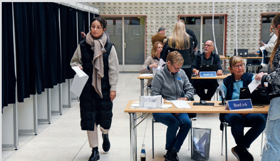
En tredjedel af stemmerne på Fyn gik til Socialdemokratiet. Billedet er fra afstemningsstedet på rådhuset i Odense.

Lars Løkke Rasmussen (M) steg op af asken som en Fugl Fønix og sikrede sig