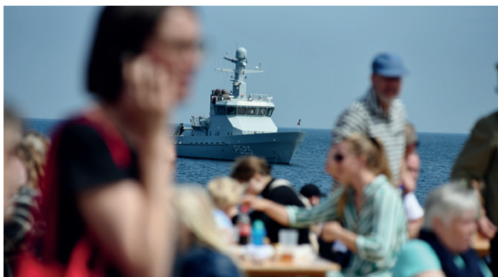
Folkemøde på Bornholm i den storpolitiske spændings skygge.

Det er naturligvis ikke kun på Folkemødet, at bekymringen og