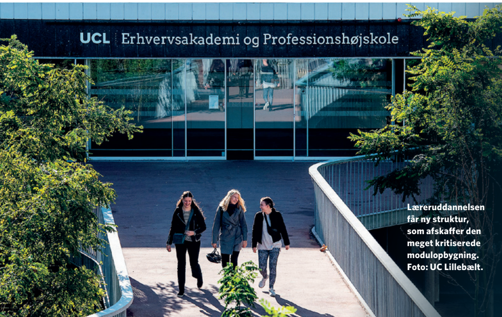
Læreruddannelsen får ny struktur, som afskaffer den meget kritiserede modulopbygning.