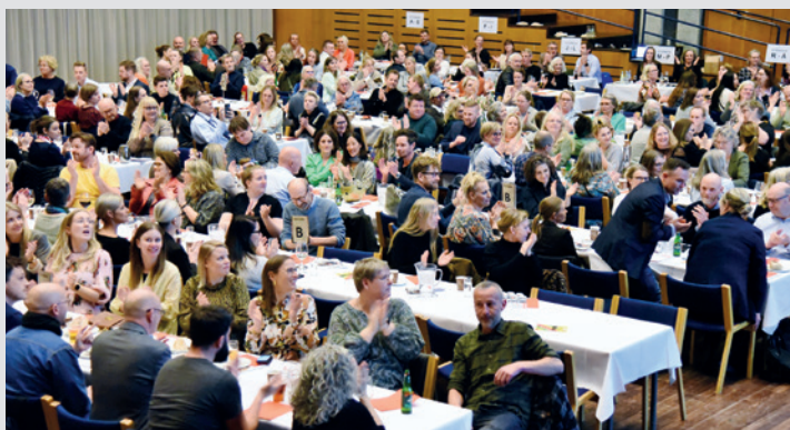
Omtrent 300 medlemmer deltog i årets generalforsamling.

OLF-GENERALFORSAMLING 2022 // Der skal fremover kun afholdes generalforsamling hvert andet år i Odense Lærerforening. 12 kandidater stillede op til 7 poster.