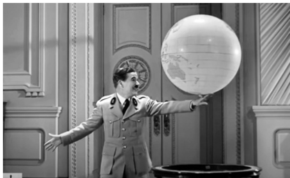
Fra filmen "The great dictator" fra 1940 (på dansk: "Diktatoren") af Charlie Chaplin.