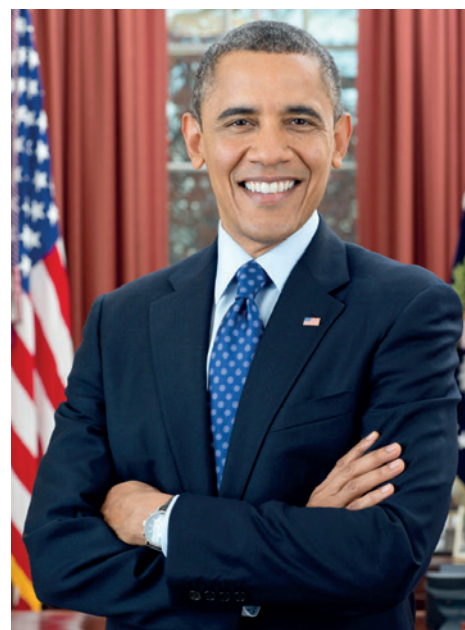
Barack Obama har hyldet Grundtvigs tanker.

Grundtvigcentret, Aarhus Universitet, skriver således, at Grundtvig var langt mindre involveret i højskolen, end rygten siger.