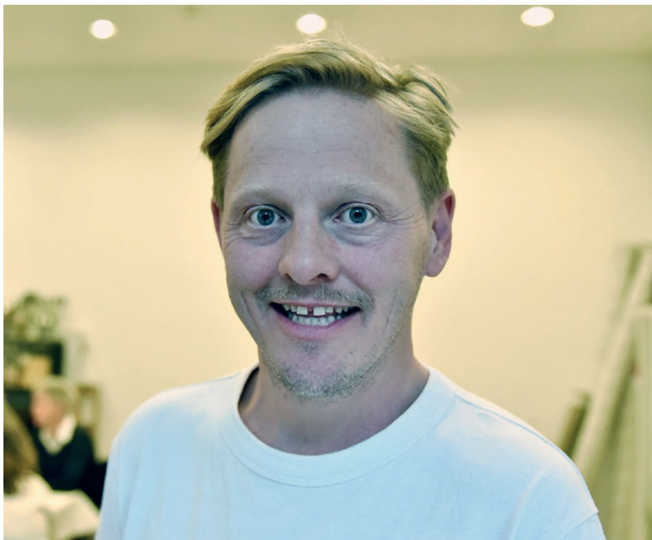
Thure Lindhardts foredrag i Kerteminde var mere end et foredrag. Nærmere en særlig fusionsgenre, hvor man kunne opleve ham foredrage, performe og spille skuespil. I øvrigt i strømpebukser. Han havde medbragt en pianist, og der var bestemt store øjeblikke under forestillingen.

Thure Lindhardt har medvirket i store spillefilm og tv-serier som for eksempel Broen, Flammen og Citronen, Nordkraft og Blå mænd, og han har haft international succes med roller i filmatiseringen af Dan Browns ”Engle og dæmoner” og ”The fast and the Furious 6”.