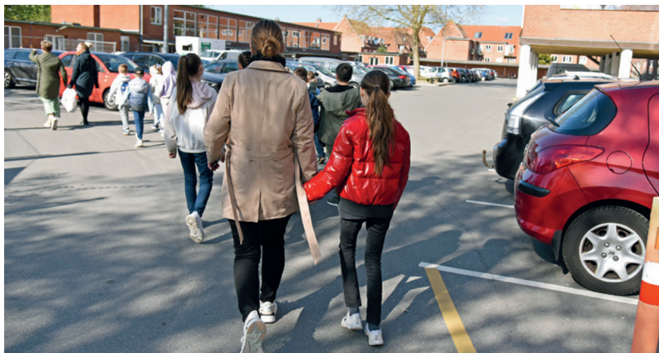
De ukrainske skoleelever på vej fra Korsløkkeskolen til fodboldklubben OKS' bane- og legepladsanlæg.

DE UKRAINSKE SKOLEBØRN // Alting forandrer sig hele tiden på den genopstandne Korsløkkeskolen, der er etableret som modtagelsesskole for ukrainske flygtningebørn i Odense. Per 12. maj er der fem klasser, den 19. maj vil der være otte.