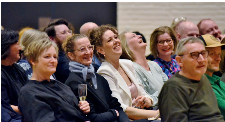
At domme på lærerpublikummets reaktion var Brinkmanns foredrag både spændende og lejlighedsvis underholdende.

TRIVSEL // Svaret på manglende trivsel er dannelse, mener Svend Brinkmann. Men ikke en hvilken som helst.