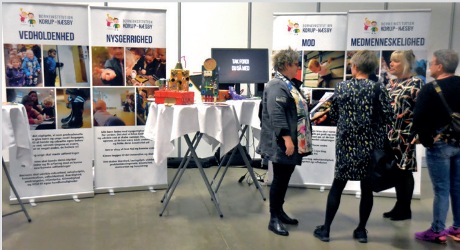
I 2017-papiret vægtede Odense Byråd fire karaktertræk i arbejdet med børn og unges dannelse.