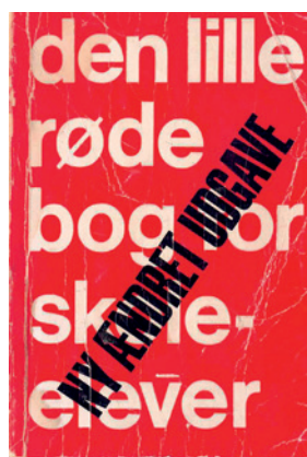
Den lille bog for skoleelever udkom i 1969, men denne reviderede udgave er fra 1970.

Fra "Den lille røde bog for skoleelever" af Bo Dan Andersen, Søren Hansen og Jesper Jensen, Hans Reitzels Forlag, 1970