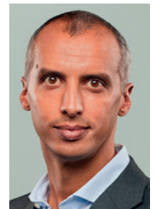
B&U-minister Mathias Tesfaye vil gerne have flere unge til at vælge erhvervsuddannelser.

– Som lærer skal man godt nok være omstillingsparat. Når politikerne kommer med et nyt forhippet princip, så tænker de bare, at det kan lærerne da lige gøre. Men muligheden skal være der. Ressourcerne skal være der.