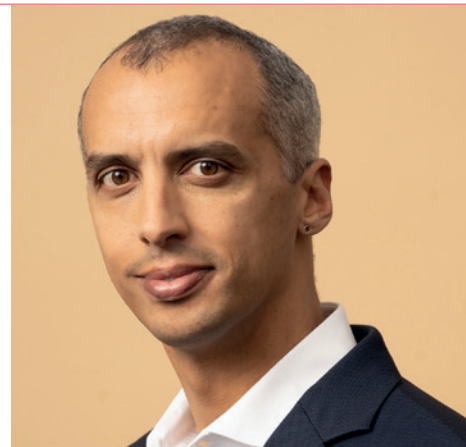
Børne- og undervisningsminister Mathias Tesfaye.

Men der er et påfaldende sammenfald mellem oprustningen til arbejdsdannelse og undervisningsminister Tesfayes uddannelsesøkonomiske og politiske kampagne for større praksisfaglighed med henblik på at få flere elever til at søge erhvervsuddannelserne. ▲