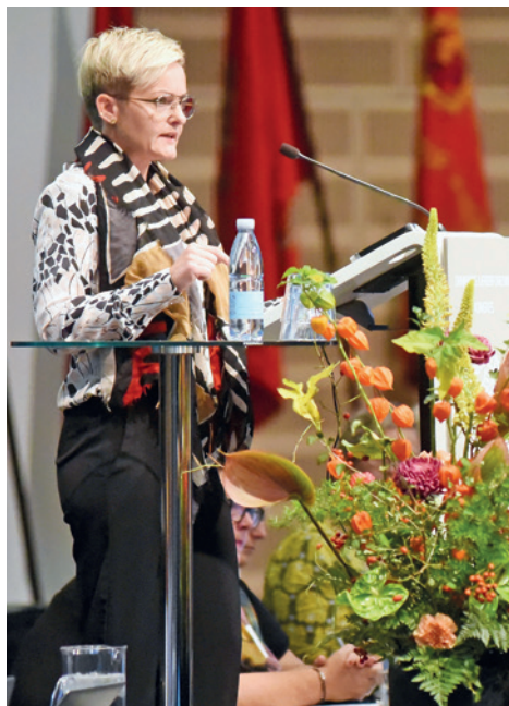
Undervisningsminister Pernille Rosenkrantz-Theil vil give skolerne mere frihed.