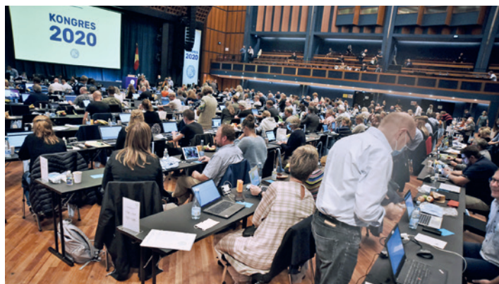
Normalt varer kongressen to dage, men på grund af coronaepidemien var alt skåret ind til benet. Både antallet af taler, selskabelighed og mad var reduceret til et minimum.