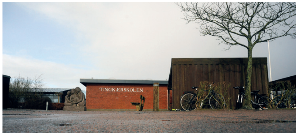
Tingkærskolen er én af de skoler i Odense, hvor medarbejdertrivsel ifølge trivselsmålingen er bedst.

TRIVSELSMÅLINGEN 2020 // Lærerne er generelt blevet lidt mere tilfredse med jobbet. Skoleledelsen betyder meget for arbejdsmiljøet og lærernes trivsel.