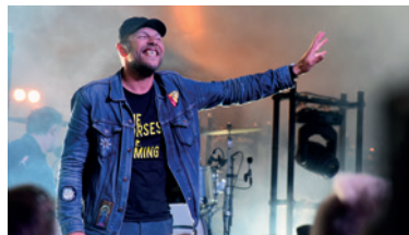
Johan Olsen, Magtens Korridorer.

- Et ord kan være smukt, fordi det lyder smukt, fordi det har en klang, en melodi, og det kan også være smukt, fordi det associerer til noget smukt eller positivt. Det kan være svært at vide, om det er det ene eller det andet, der gør et ord smukt. Jeg elsker ordene akeleje, lysning, brænding, havmåge, vingefang og stjerneklar. De har fine melodier med dejlige associationer. Hvis det bare var melodien, ville merværdi også være med. Prøv at sige det frem for dig, langsomt, kærligt og lavmælt: Merværdi. Det er rart, synes jeg. Men betydningen er så upoetisk, at selv kratskov er bedre."