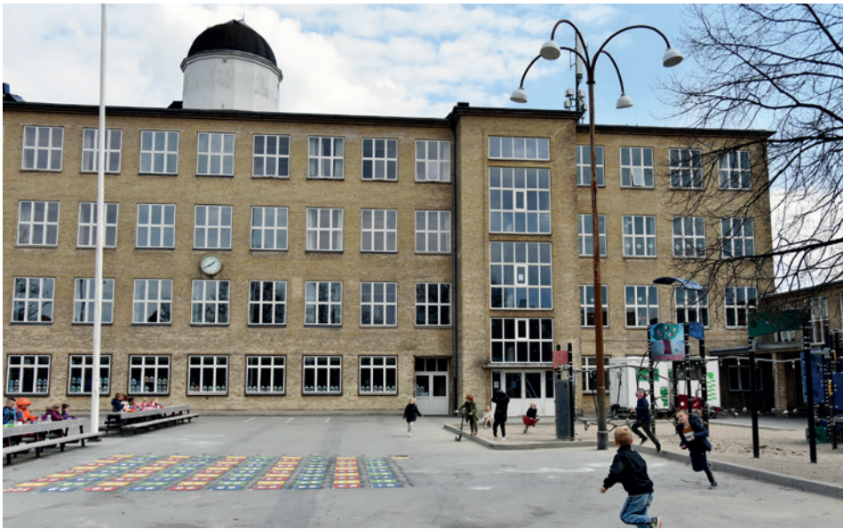
Coronakrisen har sat sit præg på skolegården. For at skabe mest mulig tryghed har skoleledelsen i coronaperioden skrevet brev til forældre og lærere hver fredag. Nyskabelsen kaldes „fredagsbrevet“.