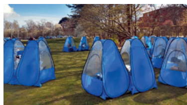
Udendørs klasseværelse på Risingskolen.

Jo, der var i sandhed tale om "The great reset" på Risingskolen.