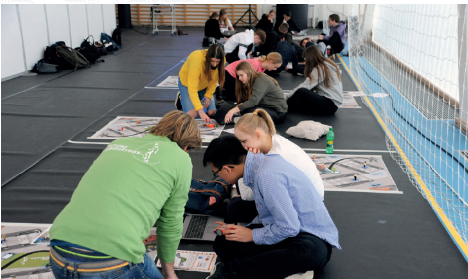
Forsøget med teknologiforståelse i folkeskolens obligatoriske undervisning har taget udgangspunkt i to modeller: Teknologiforståelse som selvstændigt fag og teknologiforståelse integreret i eksisterende fag.