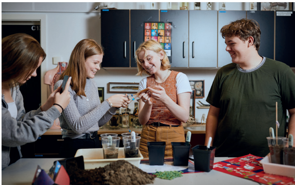
Skoleelever fra Stenlille Skole arbejder med Life-forløbet We grow .

PRIVATE FONDE OG FOLKESKOLEN // Novo Nordisk-fond tilbyder undervisning i nyt naturfagslaboratorium, men forsker advarer mod filantropiske gaver fra fonde.