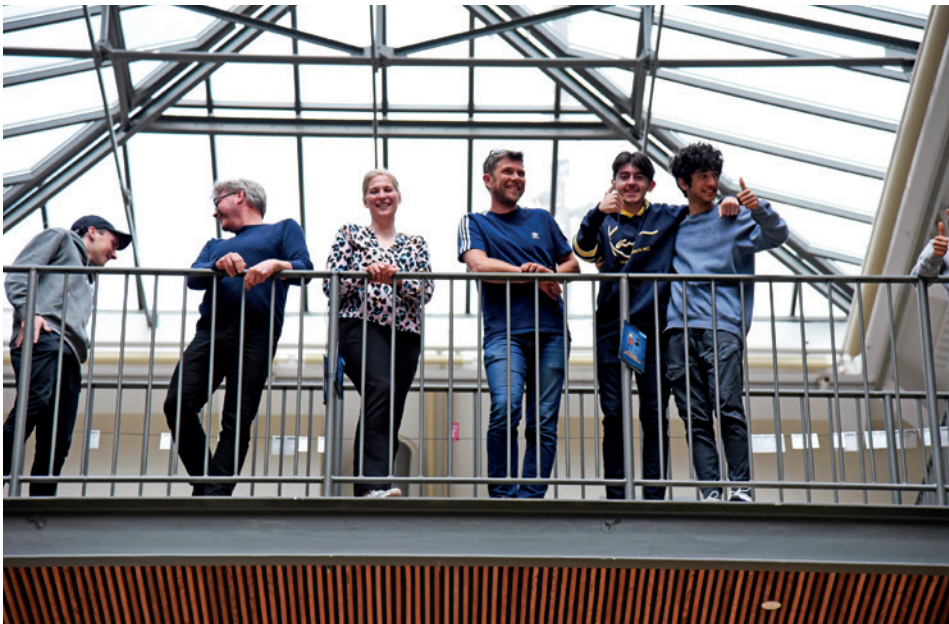
Munkebjergskolen har én af byens smukkeste aulaer med åbent op til øverste sal, hvor de ældste elever residerer.

er en aftale, vi bakker op om. Vi tager samarbejdet alvorligt. Så når vi foretager prioriteringer, er det ikke mine prioriteringer, men vores samlede prioriteringer.